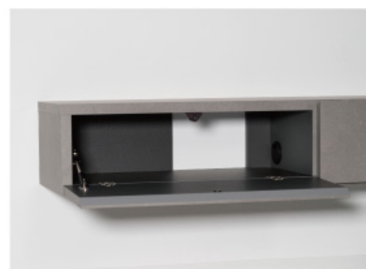
配線がすっきりする 背面のオープンスペース