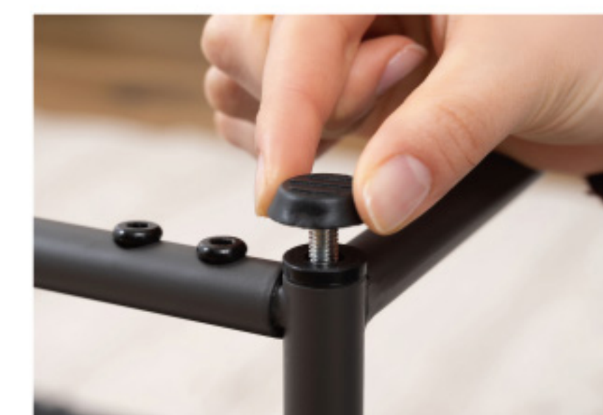
アジャスター付き