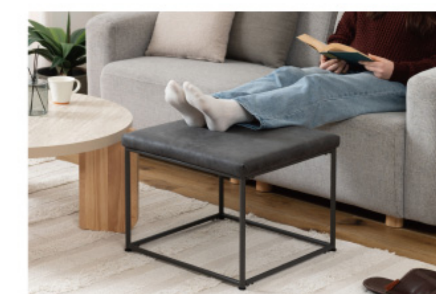
オットマンとして