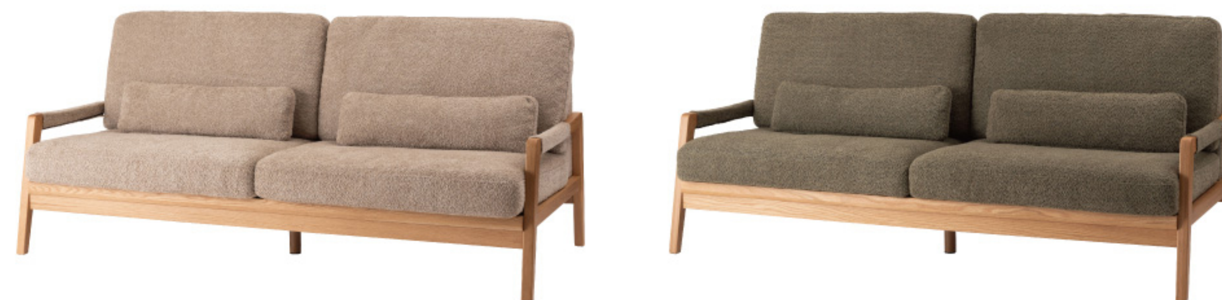
F1-105BE 235742 F1-105KH 235759

オーク材のフレームがあたたかみを演出するソファ。ゆったりとした座面でのびのび使えます。背・座ともに大ボリュームな設計でクッション性も抜群です。背面にも本体と同じ生地を使用し、後ろ姿にもこだわりました。BE/KHは人気のブークレ生地を、CAはクロスレザーを採用しています。