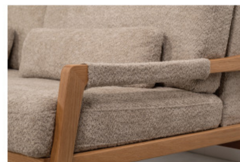
本体と同生地のアームカバー